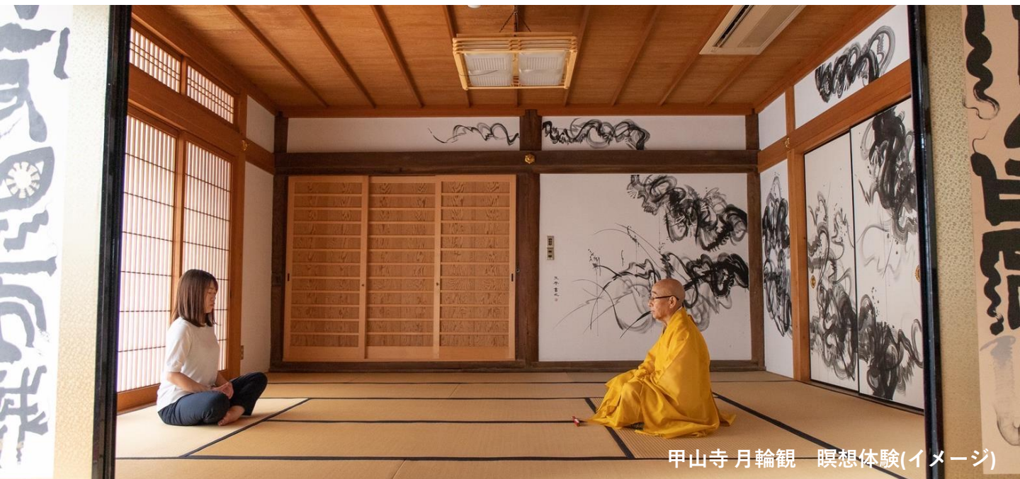
甲山寺 月輪観 瞑想体験(イメージ)

瞑想体験は、自己をみつめ、御仏の心を知り、不思議なすがすがしさを味わえる貴重な体験です。疲れた日々から解放されるひとときをお過ごしください。(体験時間:約20～30分)