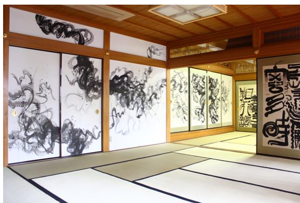
甲山寺 襖書 (イメージ)