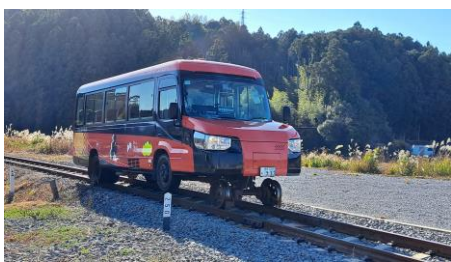
レールの上をやってきました。

先日、徳島県に「DMV」を見に行ってきました。DMVとは「デュアル・モード・ビークル」の略で、マイクロバスをベースに改造され、線路走行用の車輪を装備しており、線路では列車に、道路ではバスへとモードチェンジする車両です。本格的に営業運行を行うのは、世界初となっております。「阿佐海岸鉄道」が徳島県海陽町と高知県東洋町をつなぐ区間を運行し、さらに土日祝日は室戸方面へ1日1往復運行しております。鉄道に興味のあるみなさんは、是非お訪ねください。