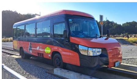
バスモードへ変身中